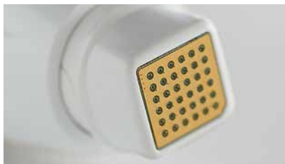
Фото 2. Аппликатор для микроигольчатого RF с установленным наконечником gen36. Толщина игл — 150 мкм. 36 игл расположены на площадке 1,5 × 1,5 мм