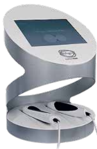
Фото 5. Аппарат Divine Pro (Pollogen) by Lumenis, Израиль

За счёт этого тепло можно аккумулировать на большой глубине, а тепловая нагрузка на поверхность кожи в месте контакта каждого электрода минимальна. TriPollar RF осуществляет сугубо терапевтическое воздействие. Разогрев кожи и подкожно-жировой клетчатки происходит до температуры не выше 43 °С, и повреждение тканей исключено. Результат применения TriPollar RF — это не только активация фибробластов и запуск липолиза, этот этап подготавливает кожу к следующему, поскольку немедленный эффект TriPollar — увеличение количества воды в коже. На следующем этапе процедуры DPF, когда будут использоваться микроиглы, дополнительная увлажнённость будет способствовать более эффективному разогреву [Фото 1].