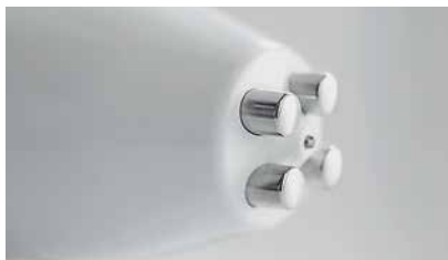
Фото 1. Аппликатор TriPollar RF для неинвазивного RF-лифтинга и динамической мышечной активации. Встроенный термодатчик контролирует температуру кожи