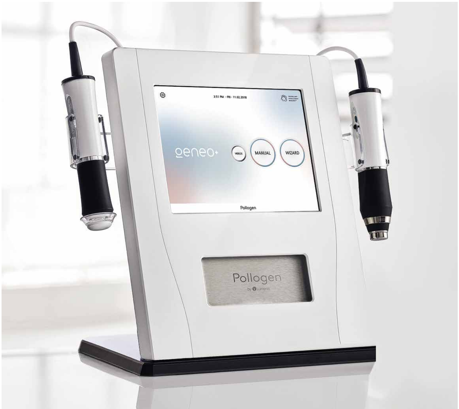
Фото 1 . Аппарат Geneo

В стандартный протокол Geneo входит четыре этапа, в ходе которых на кожу воздействует шесть различных факторов.